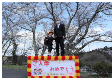
小学校入学式の日の特設した『お立ち台』