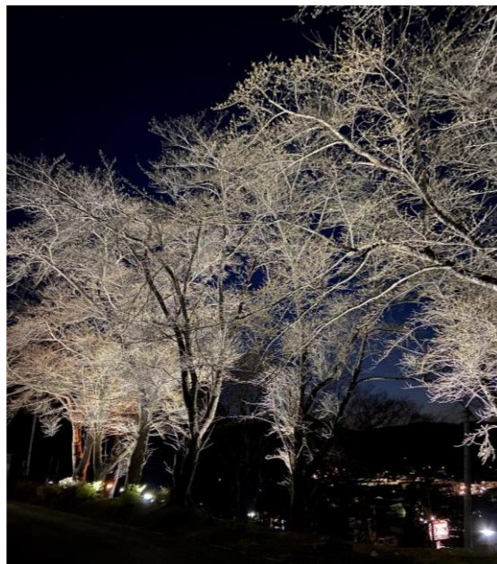
街灯がない夜空に良く映えて見えたセンター裏側の桜